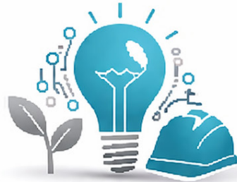
السلامة والاستدامة Safety & Sustainability