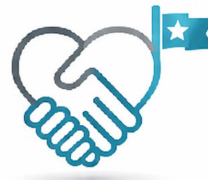
الشراكات طويلة الأمد Long-term Partnerships