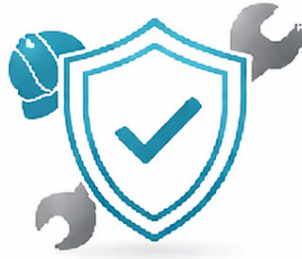
الجودة والاحترافية Quality & Professionalism