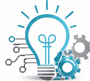
الابتكار والتطوير Innovation & Development