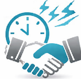
الالتزام والموثوقية Commitment & Reliability